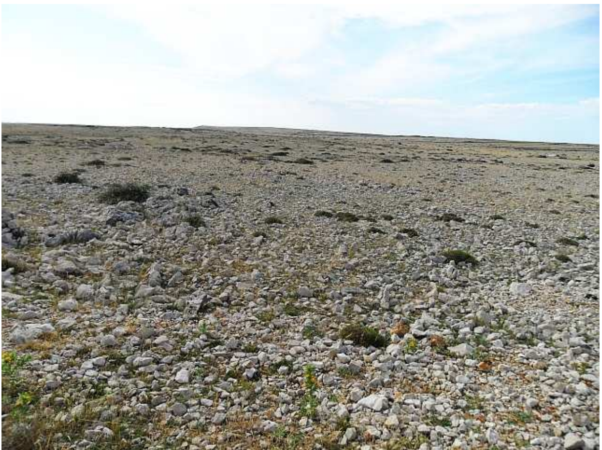
Mjesečev krajolik a' la Pag.