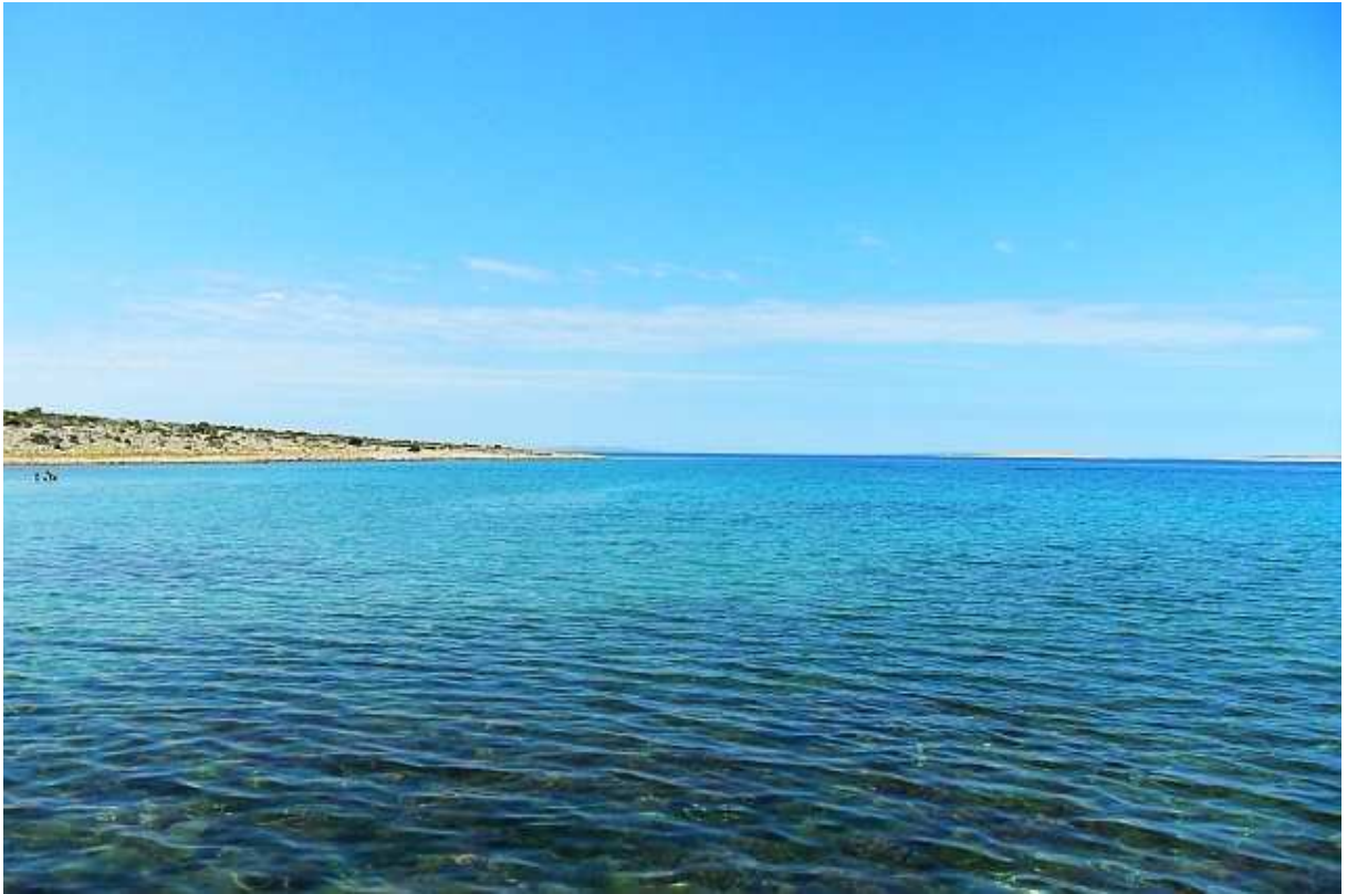
Plaža s tirkiznim pijeskom u Proboju, selu s par kuća bez dućana i gostionice, i pogledom na sjeverozapadnu pučinu.