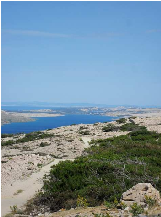
Paški zaljev – pogled na sjeverozapad.