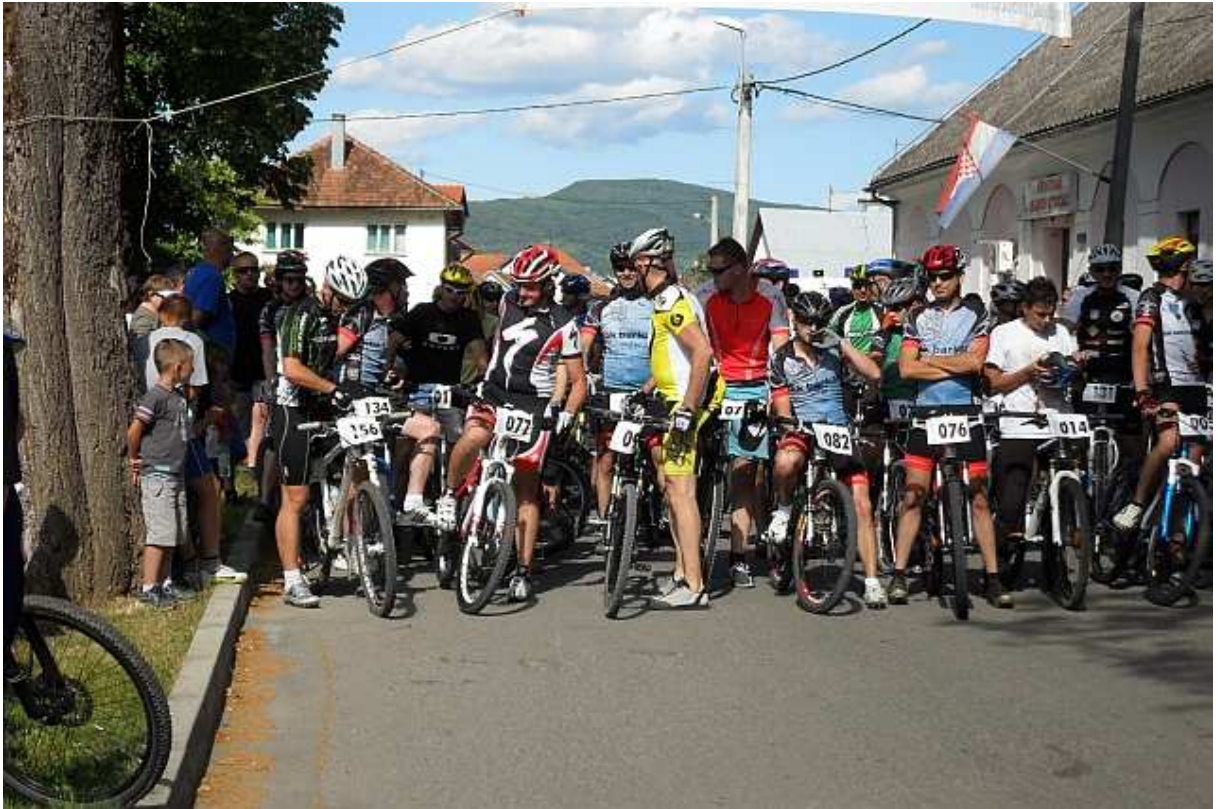
Razlaz! Glavni baja ulazi u startnu liniju! ☺☺☺