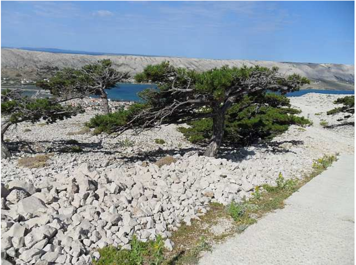
Patuljasta crnogorica umlaćena burom.