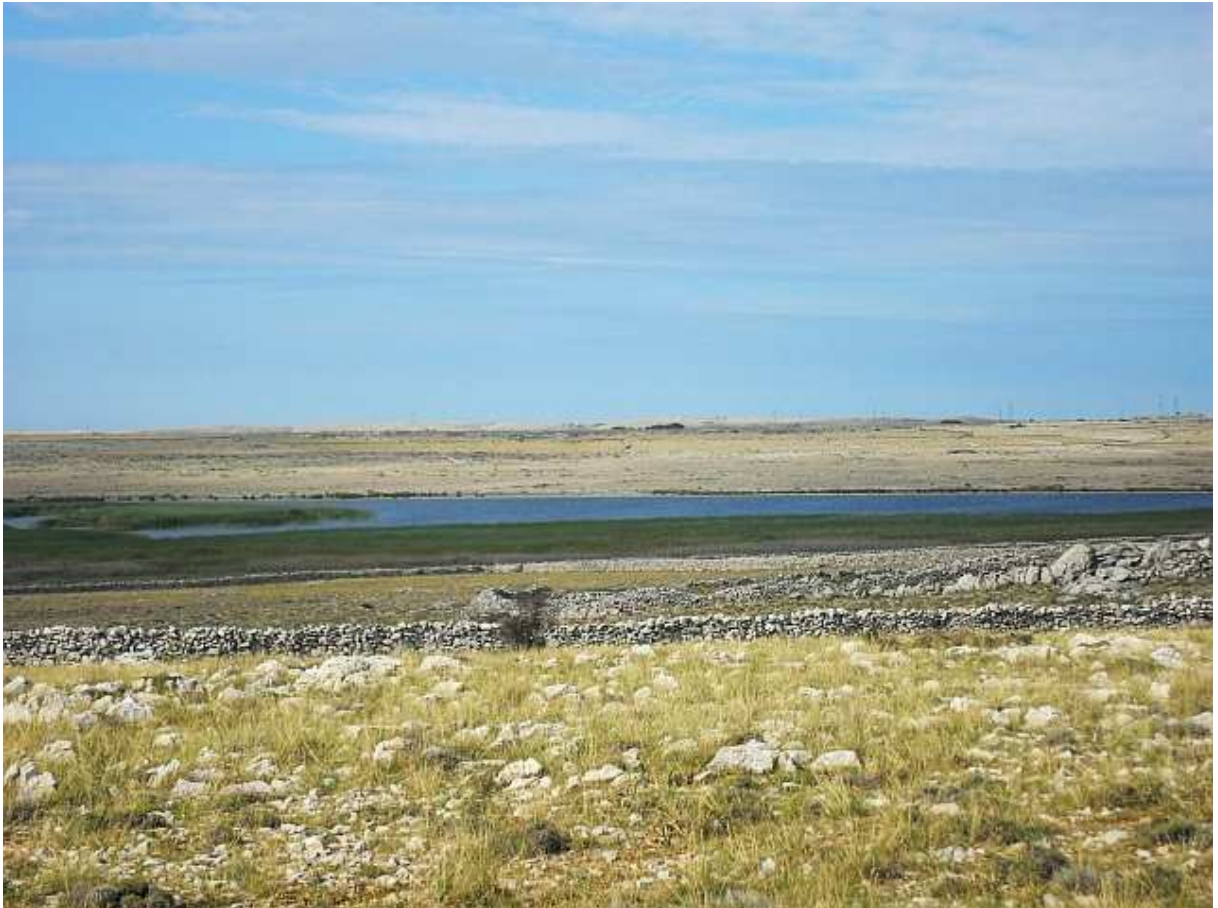
Ornitološki rezervat Veliko Blato. 'Tice su se posakrivale i ako ni'es' nosil duplenku. ☺