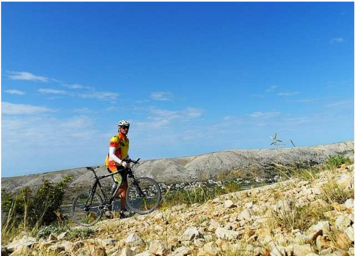
Kada „slickovi“ prokližu na paškom „šoderu“.