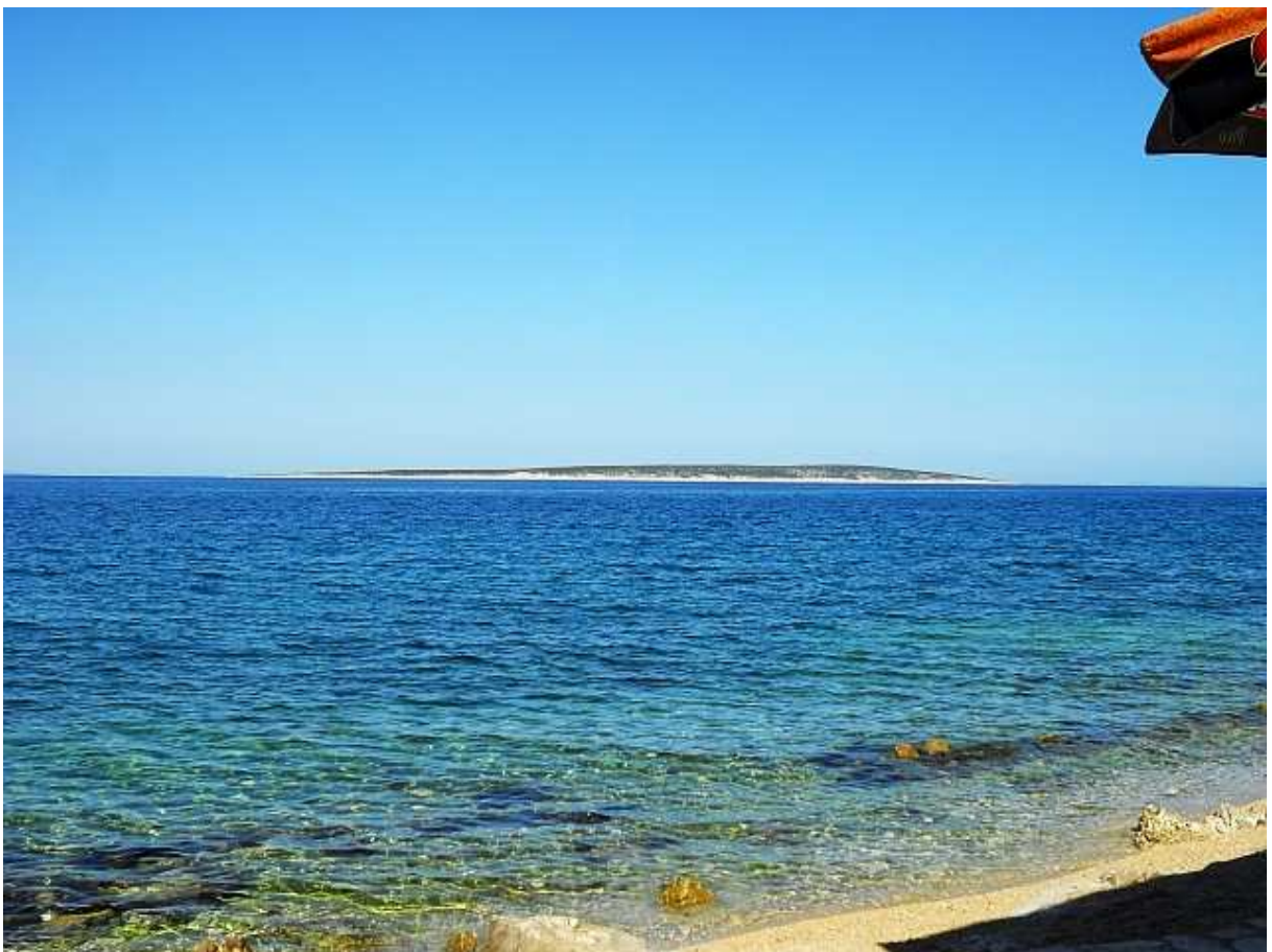
Pogled na Škardu. Snimljeno na pauzi za kavu u Mandrama.