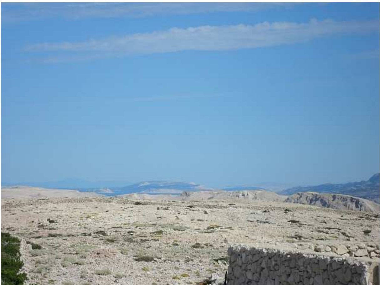
Rab i Učka na obzoru.