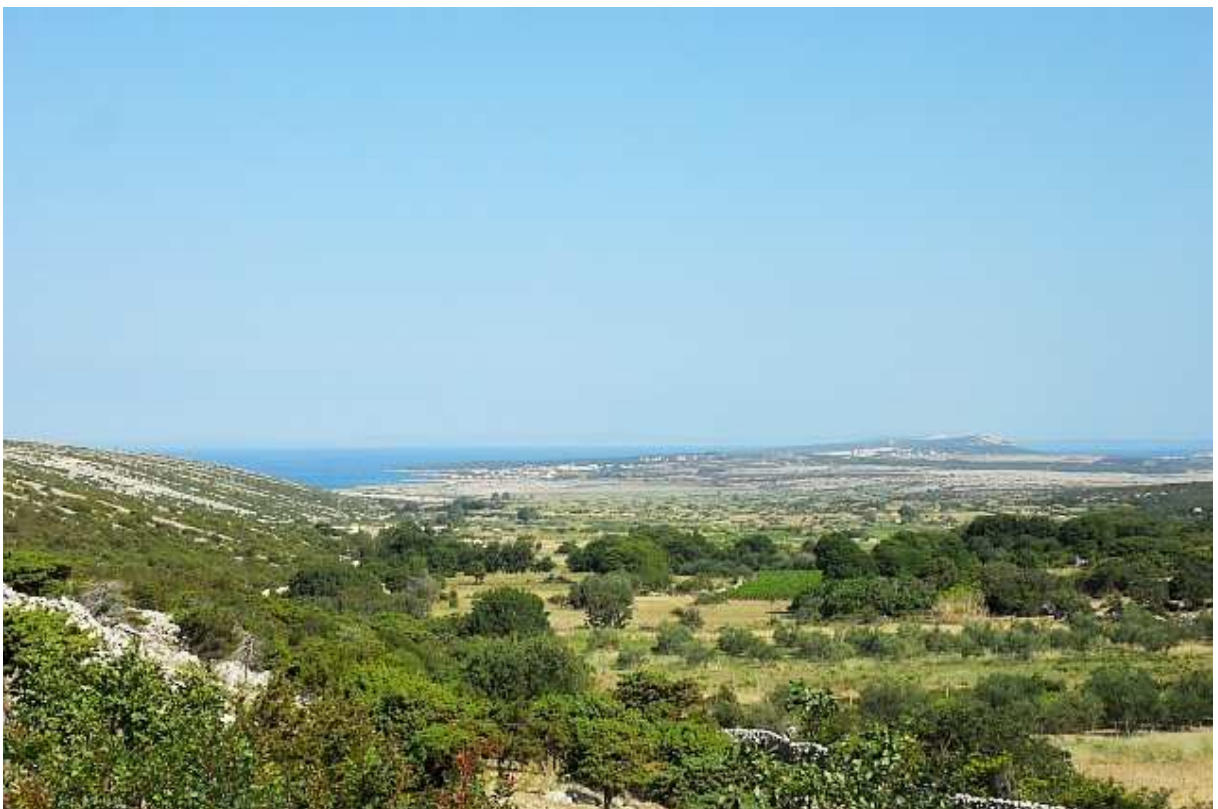
Pogled prema Novalji