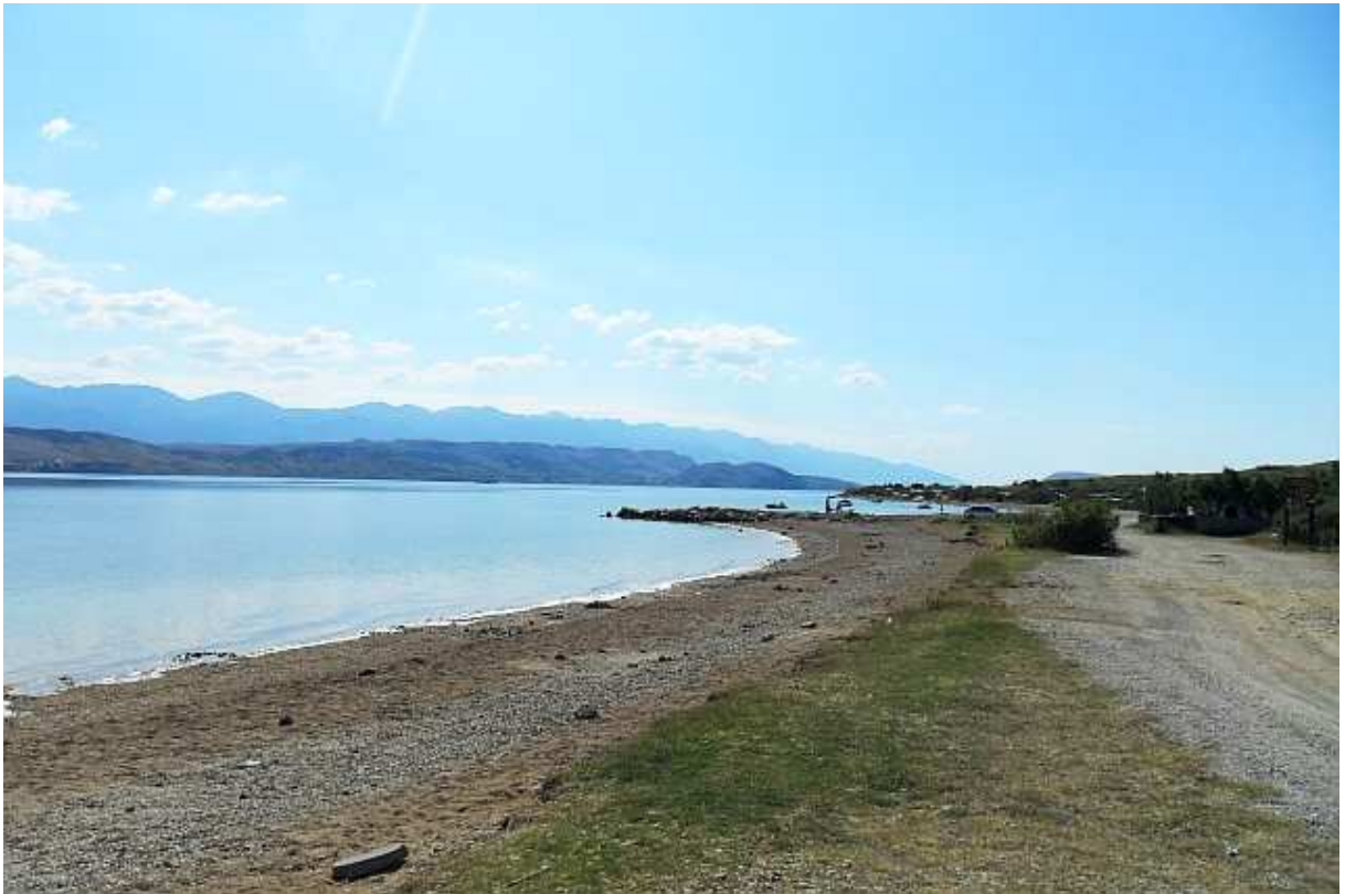
Plaža i kamp Sv. Duh u Paškom zaljevu.