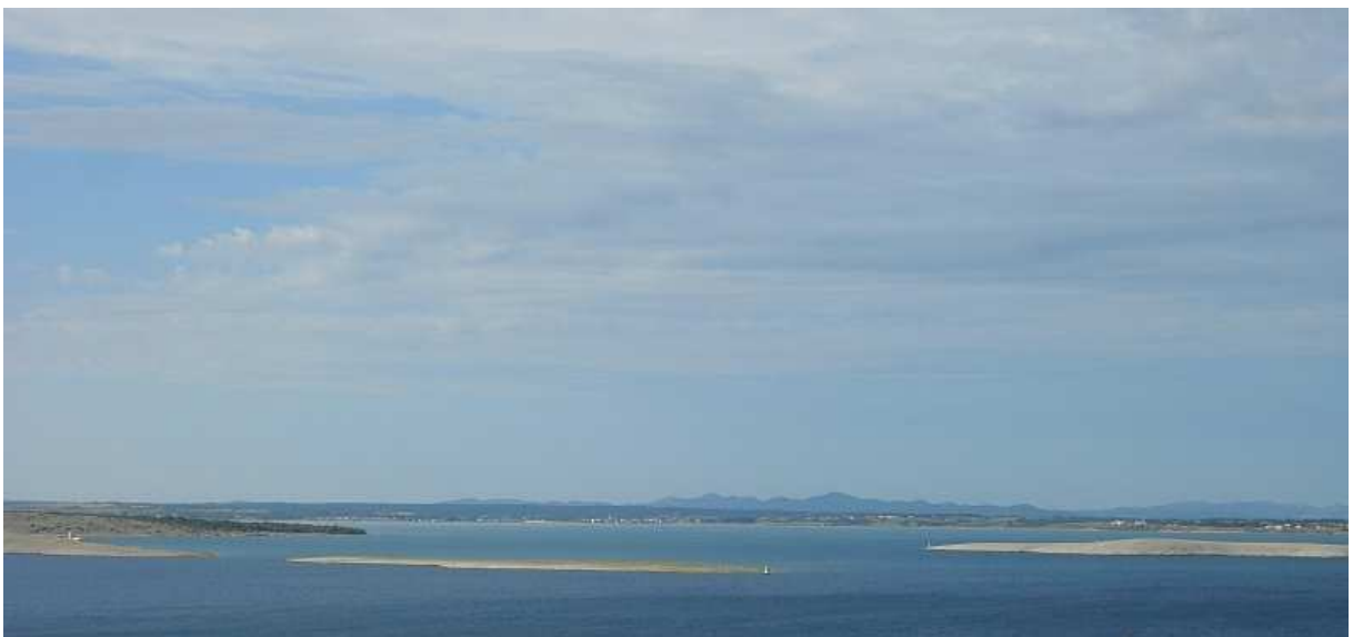
Iz Smokvica pogled puca na Ninsku valu i vrhove Ugljana, Pašmana i Dugog otoka.