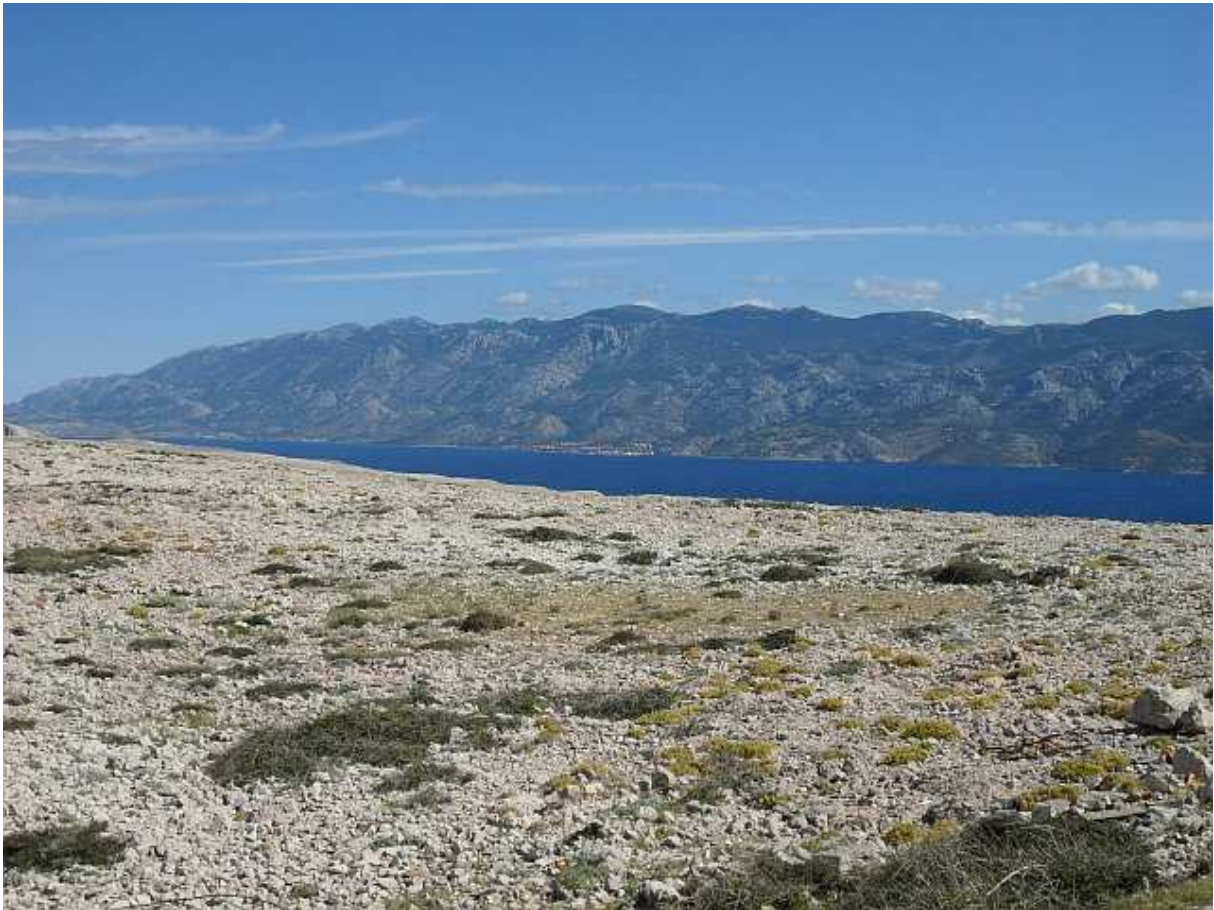
Mali Karlobag i veliki Velebit.