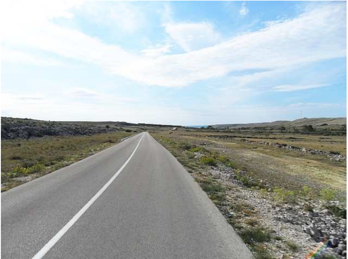
Prema Vlašićima i Smokvici.