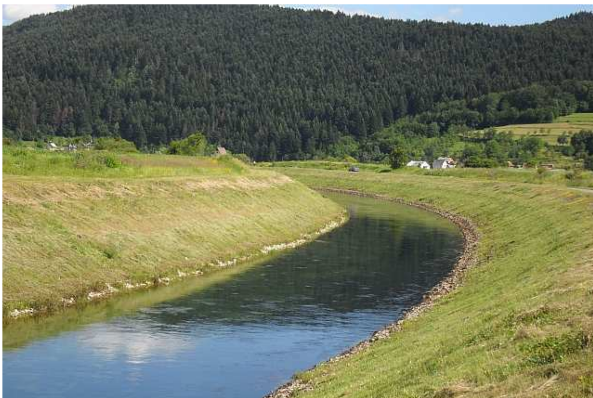
Snimljeno na zagrijavanju za biciklijadu. Ušorena Gacka.