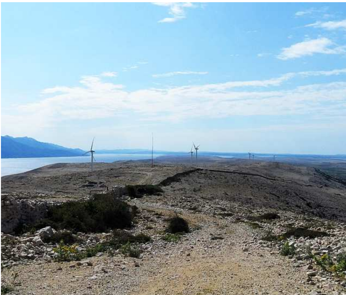
Tu se pravi struja od vjetra!